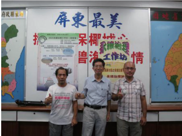
2015/10/09 永續至裡工作坊屏東場