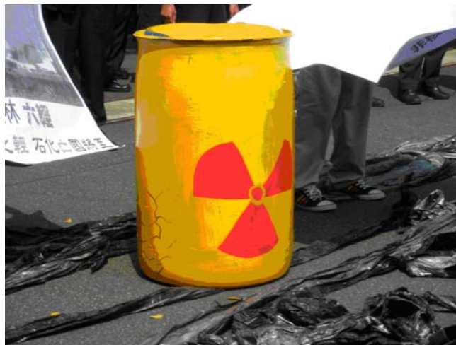
(圖一)核廢料桶近照

經建會對於台灣未來產業轉型的願景，以六大新興產業來規劃，也就是綠能、文化創意、生技、觀光、知識經濟等為主軸，一手以永續發展的理念來打造「安全自然生態島」、「優質生活健康島」和「知識經濟運籌島」，另一手卻仍守著舊思維，還要繼續擴張石化產業！這是價值觀徹底的混淆和錯亂。