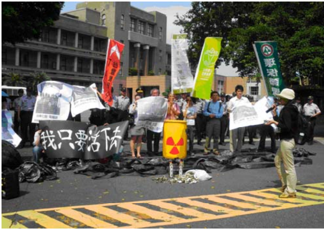
(圖三) 環保團體聯合請願活動照

活動起點從善島寺出發，一路步行至行政院門口，參與人員將核廢料桶、有毒綠牡蠣、塑膠布、塑膠管以及有害污水等這些有害物質陳列於行政院門前。活動期間，環保代表將這些污染物所蘊含的危機大肆宣導；也同時宣布將用一年時間，紀錄各地公害情況，製作出「台灣公害地圖」一書，讓各界人士能夠採用。活動進行約一個小時半左右結束，而行政院內部派出代表與活動發言人做直向溝通，望中央能做相關改善動作。